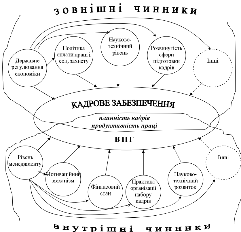
Рис. 2. Чинники кадрового забезпечення ВПП

Отже, у країнах-членах Європейського Союзу склалися більш сприятливі умови для ефективного забезпечення кадрами суб'єктів господарювання у видавничо-поліграфічній сфері. З наведеної загальної характеристики спільних рис видно, що як зовнішні, так і внутрішні чинники кадрового забезпечення (рис. 2) в Україні синергетично впливають на розвиток ВПП в значно меншій мірі, ніж в Європейських державах. Якщо за першими 3–4 ознаками Україну можна долучити до європейського досвіду, то за іншими — вона відстає.