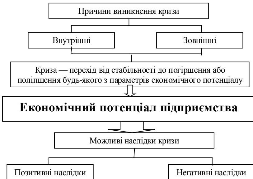
Рис. 2. Передумови виникнення кризи та її наслідки для діяльності підприємства

З вищенаведеного широкого спектра думок стосовно сутності поняття «криза підприємства» та сучасного трактування економічного потенціалу підприємства можна систематизувати єдине визначення, яке має ввібрати в себе раціональне зерно кожного з поданих варіантів. Так, під впливом зовнішніх і внутрішніх чинників підприємство може з різним рівнем ефективності використовувати складові економічного потенціалу. А якщо взяти до уваги, що кризою можна вважати будь-яку позитивну чи негативну зміну в системі, то криза підприємства — це перехід від стабільності до поліпшення або погіршення будь-якого з параметрів економічного потенціалу підприємства (рис. 2).