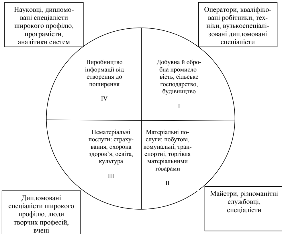
Рис. 2. Галузева модель інформаційної економіки за секторами:

Цей висновок розвитку економіки підтверджується також дослідженнями Т. П. Ніколаєвої [4], на підставі яких розроблено галузеву модель інформаційної економіки (рис. 2) та проведено аналіз людського фактора в кожному з чотирьох секторів розвитку економіки. Людський капітал, задіяний в першому і другому секторах, близький до індустріальної економіки. Відмінності полягають у тому, що трудова діяльність у цих секторах в умовах інформаційної економіки повинна задовольняти нові вимоги суспільства, передусім такі, як постійне вдосконалення навичок, інформатизація процесу, вміння працювати в команді.