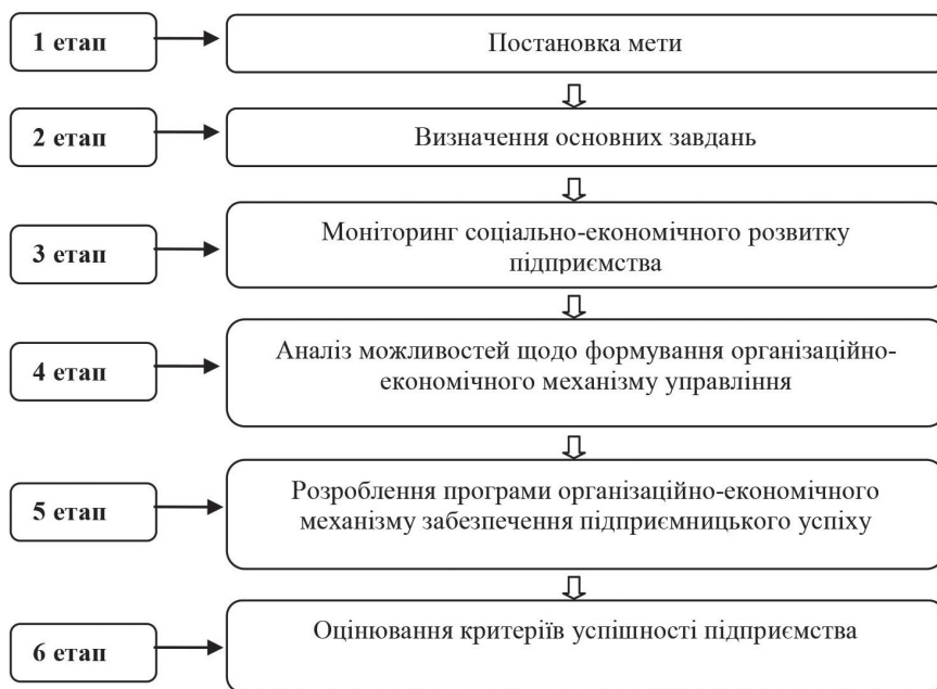
Рис. 1. Етапи побудови організаційно-економічного механізму забезпечення підприємницького успіху

для ефективної роботи кожного з них важливою є постановка правильних цілей та їхнє виконання з найменшими витратами ресурсів. Інакше кажучи, підприємство вважається успішним, якщо воно досягло окресленої мети.