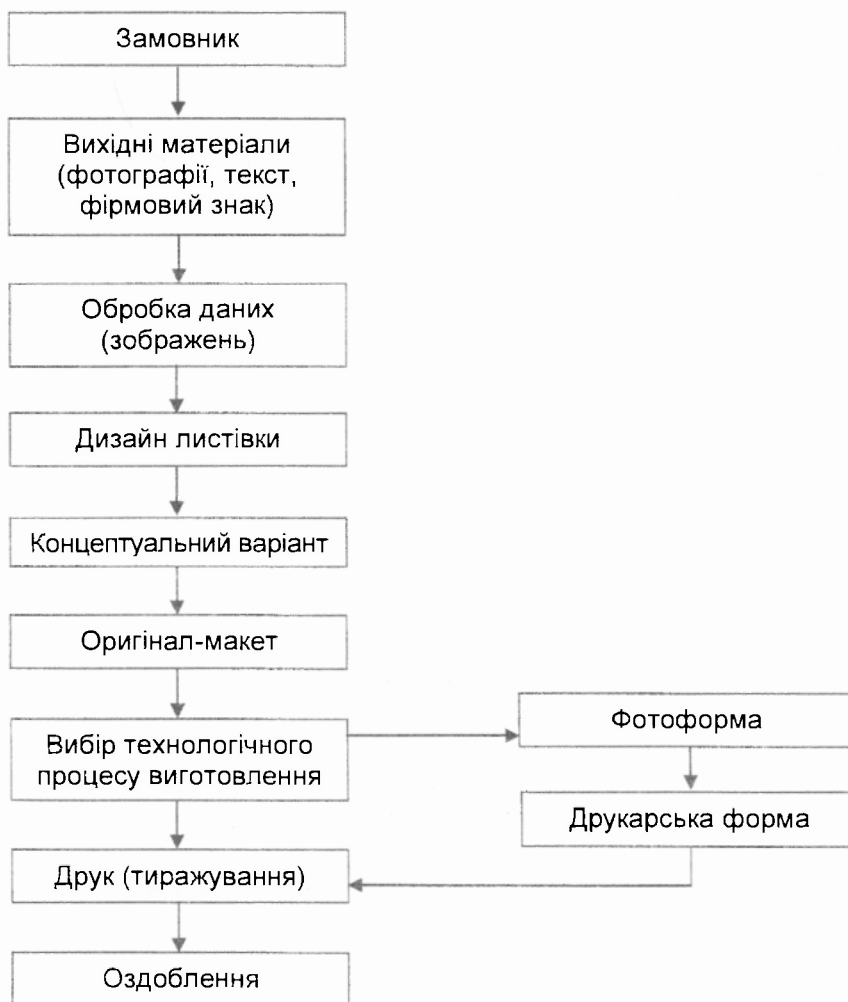
Рис. 1. Технологічна схема виготовлення листівок