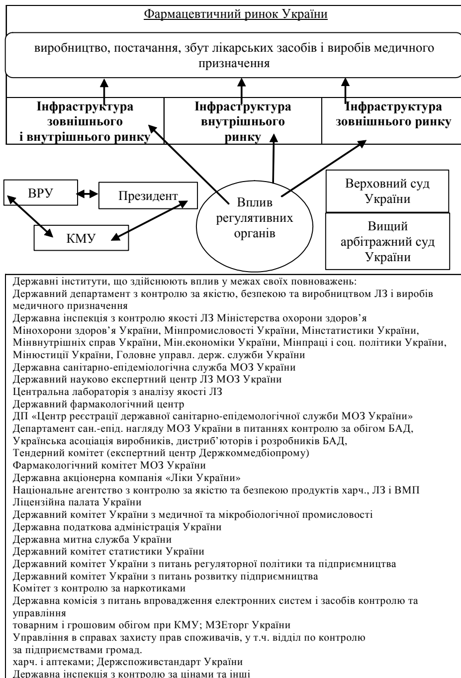
Рис. 2. Схема впливу СЗДУ на фармацевтичний ринок в Україні

манням антимонопольного законодавства, захисту суб'єктів підприємництва й споживачів від його порушень — Антимонопольний комітет України.