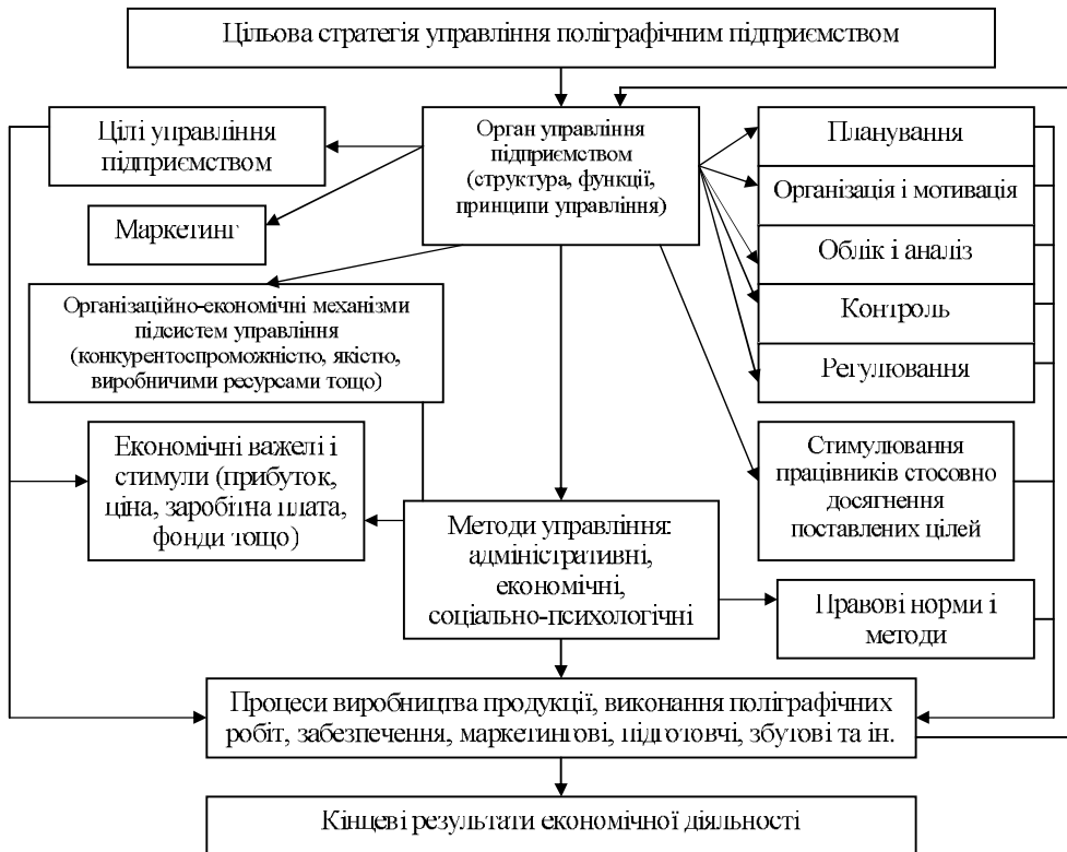
Рис. 2. Схема організаційно-економічного механізму управління підприємством ВПК

Головним елементом організаційно-економічного механізму є орган управління з його структурою, функціями, економічними важелями та іншими методами впливу на об'єкт управління. Цілі і стратегії підприємства без-