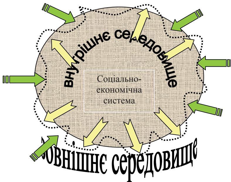
Рис. 1. Стан «відносної безпеки»

ж загрозою безпеці системи. Слід згадати й те, що безпека — це не лише стан, але й дія, спрямована на захист системи та повернення її до рівноваги. Руйнування, зміна, відхилення від рівноваги — це небезпека. Звідси, якщо до уваги ще й взяти твердження російський фахівців І. Брокхауза та І. Ефрона, безпека досягається усуненням небезпеки, а стан «небезпеки» та «безпеки» характеризується різним рівнем небезпеки, то категорію «безпеки» можна умовно поділити на «абсолютну» та «відносну». Якщо абсолютна — це стан рівноваги, якщо відносна — це стан, коли система перебуває під впливом різних факторів, які відхиляють її від рівноваги, але рівень небезпеки не є критичним для руйнації, що не ставить під сумнів виконання місії, досягнення цілей розвитку (рис. 1).