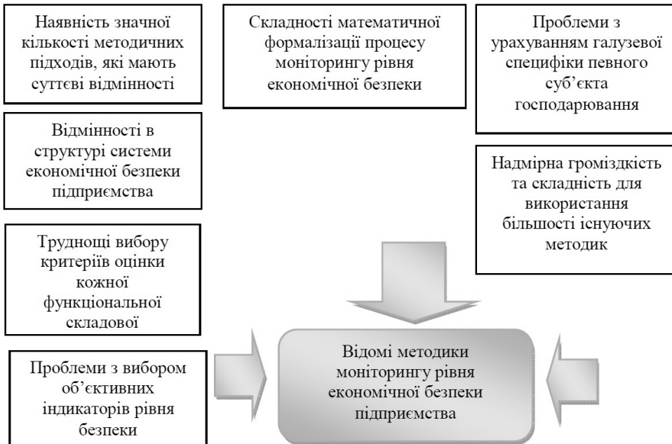
Рис. 1. Сукупність труднощів для активного застосування існуючих методик моніторингу рівня економічної безпеки

фінансових аспектів діяльності, а й інших основних функціональних складових економічної безпеки.