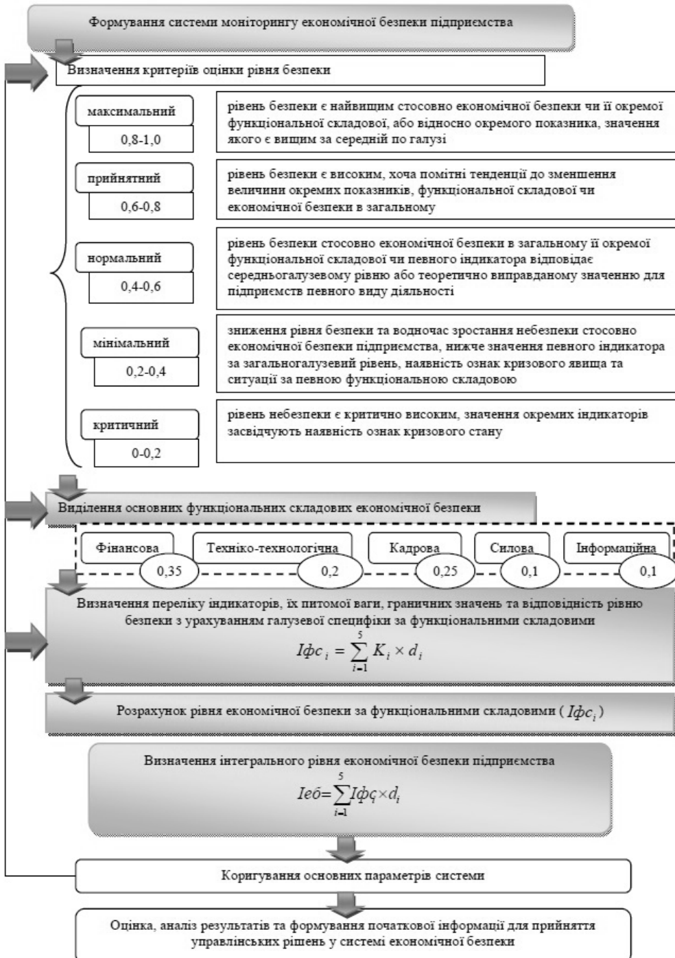
Рис. 2. Алгоритм формування системи моніторингу економічної безпеки підприємства

кожен рівень відрізняється від іншого передусім співвідношенням взаємопов'язаних понять «безпека – небезпека».