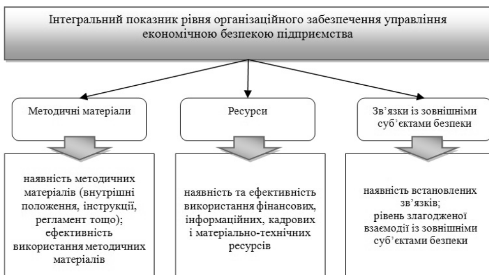
Рис. 2. Класифікація показників, що характеризують стан організаційного забезпечення управління економічною безпекою машинобудівного підприємства

Відповідно до авторського трактування організаційного забезпечення вважаємо за доцільне виділити три групи показників: методичні матеріали, наявність і ефективність використання необхідних ресурсів та формування взаємозв'язків із зовнішніми суб'єктами безпеки (рис. 2).