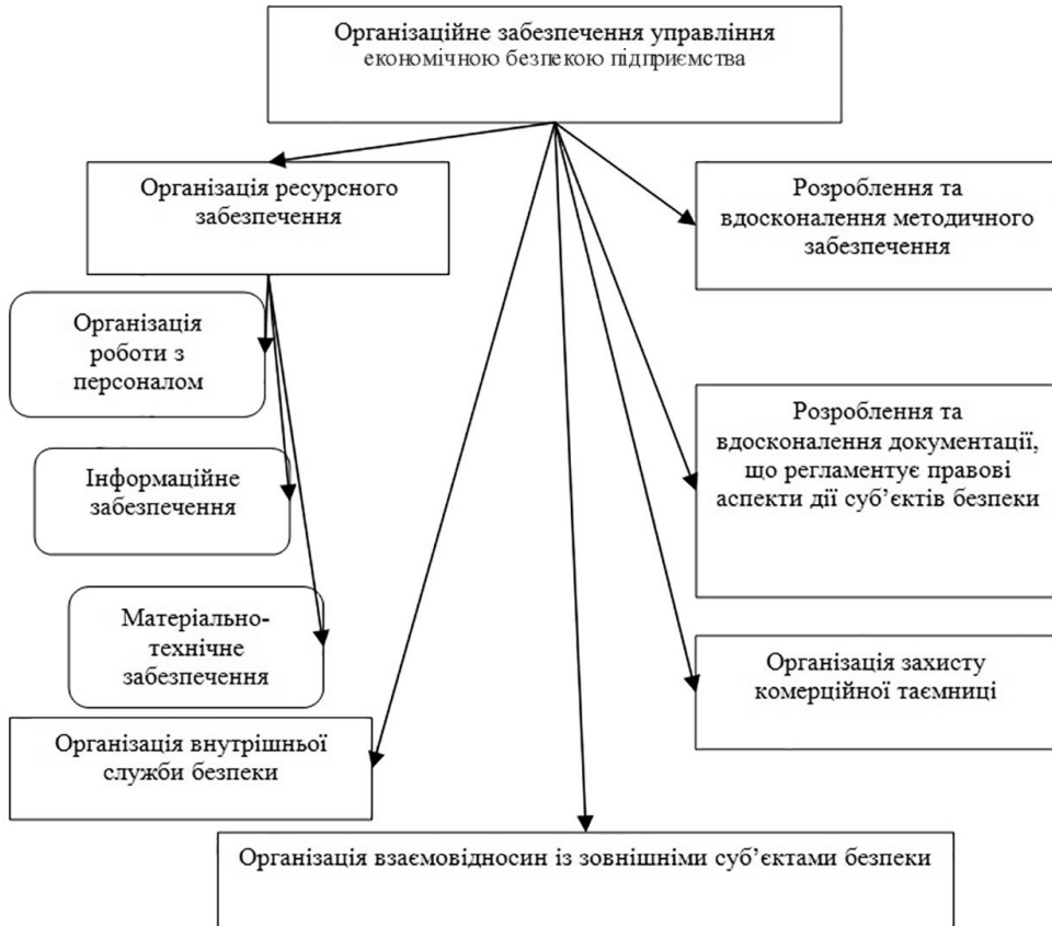
Рис. 1. Складові організаційного забезпечення управління економічною безпекою підприємства

П'ятий компонент — документація, яка регламентує створення та функціонування індивідуальної служби безпеки: