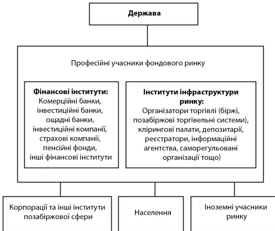
Рис. 1. Структура фондового ринку