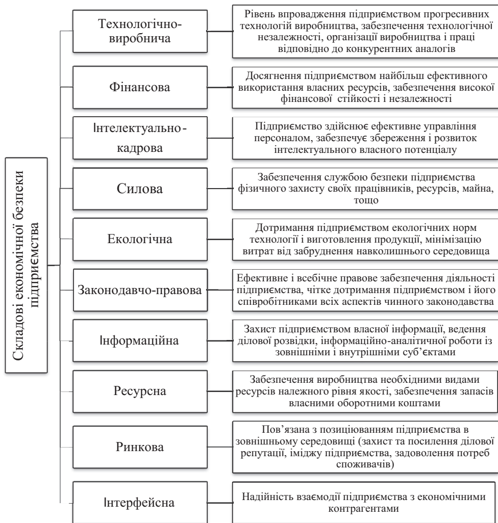
Рис. 2. Структура та характеристика складових економічної безпеки підприємства

Отже, для досягнення найвищого рівня власної економічної безпеки машинобудівні підприємства зобов'язані проводити роботу щодо забезпечення максимальної безпеки кожної його функціональної складової.