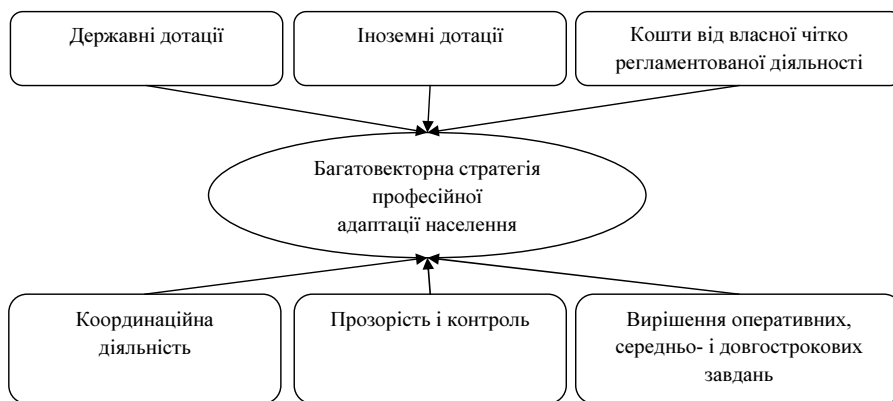
Рис.1. Організаційна структура багатовекторної стратегії професійної адаптації населення

Багатовекторна стратегія професійної адаптації населення залежно від геополітичного становища країни поєднує в собі як автономні функції, так і функції підпорядкування. Організаційну структуру багатовекторної стратегії можна відобразити таким чином (рис. 1):