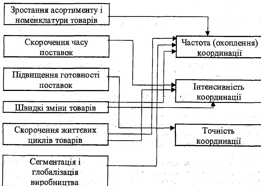
Рис.2. Тенденції та вимоги координації на ринку товарів