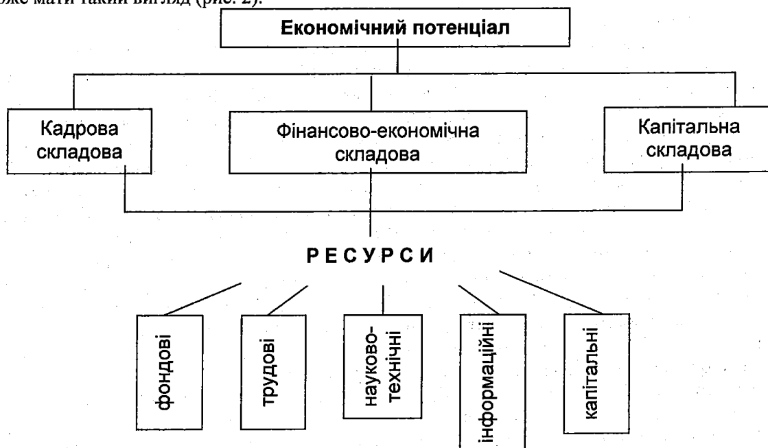
Рис.2. Структура економічного потенціалу

У нашому розумінні структура економічного потенціалу в найбільш загальному вигляді може мати такий вигляд (рис. 2).